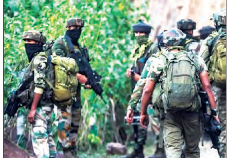
अमन को कायम नहीं रहने देंगे।

मैंने चुनाव से पूर्व अपनी एक सप्ताह की कश्मीर यात्रा में देखा कि केन्द्र सरकार ने कश्मीर में विकास कार्यों को तीव्रता से साकार किया है, न केवल विकास का बहूआयामी योजनाएं चला रही हैं, बल्कि पिछले 10 सालों में कश्मीर में आतंकमुक्त करने में भी बड़ी सफलता मिली है। बीते साढ़े तीन दशक के दौरान कश्मीर का लोकतंत्र कुछ तथाकथित नेताओं का बंधुआ बनकर गया था, जिन्होंने अपने राजनीतिक स्वार्थों के लिये जो कश्मीर देश के माथे का ऐसा मुकुट था, जिसे सभी प्यार करते थे, उसे डर, हिंसा, आतंक एवं दहशत का मैदान बना दिया। लेकिन वहां विकास एवं शांति स्थापना का ही परिणाम रहा कि चुनाव में लोगों ने बड़-चढ़ कर हिस्सा लेकर लोकतंत्र में अपना विश्वास व्यक्त किया। कहा जा सकता है कि राज्य में लोकतंत्र को मजबूत होते देख बौखलाहट में ये आतंकवादी हमले किये जा रहे हैं। दरअसल, केन्द्रशासित प्रदेश का शांति-सुदृढ़ की तरफ बढ़ना आतंकवादियों की हताशा को ही बढ़ाता है। हाल के दिनों में रिकॉर्ड संख्या में पर्यटकों का घटता में आना और गंभीर चिन्ता का विषय होना चाहिए। इन बैठे आतंकियों के आकाओं को रास नहीं आया है। जम्मू के इलाके में आतंकी घटनाओं में वृद्धि शासन-प्रशासन के लिये गंभीर चिन्ता का विषय होना चाहिए। इन हमलों में पाकिस्तान की भूमिका को नकारा नहीं जा सकता। उल्लेखनीय है कि रिविहार को हुए हमले की जिम्मेदारी जहां लश्कर-ए-तैय्याब के आतंकी गुट टीआरएफ ने ली तो डोडा में हुए हमले की जिम्मेदारी पाक पोषित