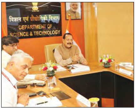
केंद्रीय मंत्री जितेंद्र सिंह विज्ञान एवं प्रौद्योगिकी विभाग की अध्यक्षता करते हुए।