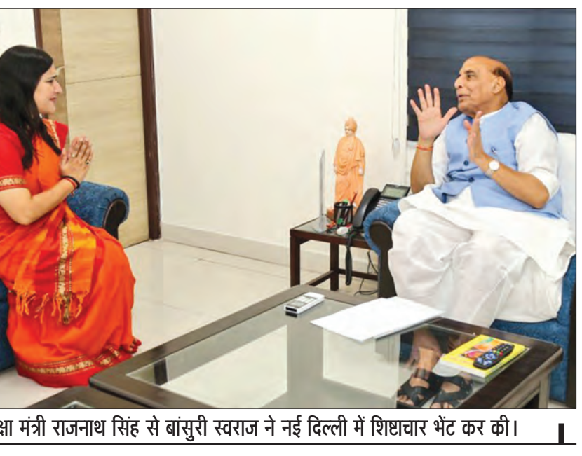
केंद्रीय रक्षा मंत्री राजनाथ सिंह से बांसुरी स्वरान ने नई दिल्ली में शिष्टाचार भेंट कर की।

उन्होंने कहा कि 24 जून को वह शपथ लेंगे और राष्ट्रपति के अभिभाषण के बाद सत्र शुरू होगा। उन्होंने कहा कि वह अंबाला लोकसभा क्षेत्र की जो भी मर्गें हैं उन्हें उठाएंगे और पूरा करवाने का काम करेंगे। वहीं उन्होंने कांग्रेस की गुटबाजी पर बोलते हुए कहा कि पार्टी में कोई गुटबाजी नहीं है। लोगों ने अब भाजपा को नकार दिया है और यह लोकसभा चुनाव में साबित हो गया है। वहीं विधानसभा चुनाव पर बोलते हुए उन्होंने कहा कि अब समय आ गया है कि जनता बदलाव चाहती है।